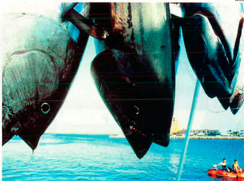
Molts dels defensors de la paralització de la pesca consideren que la tècnica del cercol és mortal per a l'espècie. La llei no diu, de moment, res sobre aquesta nova modalitat de pesca.