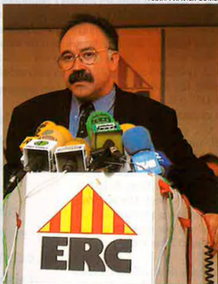
Josep Lluís Carod Rovira. El secretari general defensa una ERC amb perfil polític propi.

tra l'assoliment d'aquests acords en tres àmbits: l'impuls de la regeneració democràtica, l'enfortiment de l'estat del benestar i la creació d'ocupació, i en tercer lloc, l'avenç cap a la sobirania de la nació catalana. Per aconseguir-los proposen a nivell institucional l'impuls d'una política d'unitat al Parlament de Catalunya perquè sigui aquesta institució la que doni els ei-