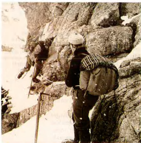
A dalt, cova del Salnitre, 1908. A sota, camí de Núria, 1909. La muntanya era l'escenari, tant se val si interior o exterior.

i normalització de Catalunya, organitzat i institucionalitzat, atiat això sí, en uns inicis, per l'embranchida renaixent. Els Jocs Florals van recuperar la llengua. L'excursionisme li asseguraria el lent camí cap a la normalització. S'inicià amb anterioritat però es materialitzà sota el mandat de Torras, durant el qual, mentre es forjaven els pilars de la Catalunya actual i se salvava el patrimoni històric, s'establien les bases de l'excursionisme modern, tot marcant la frontera entre les activitats esportives i culturals.