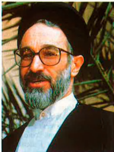
Mohammed Khatami. Candidat moderat a la presidència d'Iran.

industrial, de la construcció i del comerç.