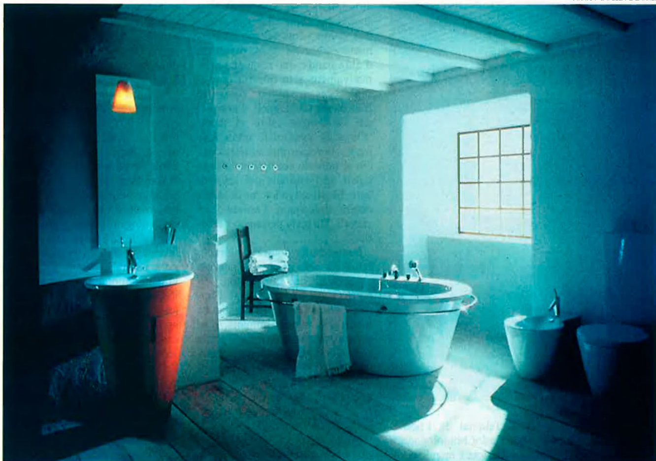
Duravite (1994) o la personal interpretació d'una antiga cambra de bany. Baix, Lama d'Aprilia. Un scooter que, segons Starck, se l'ha d'estimar com un gosset.