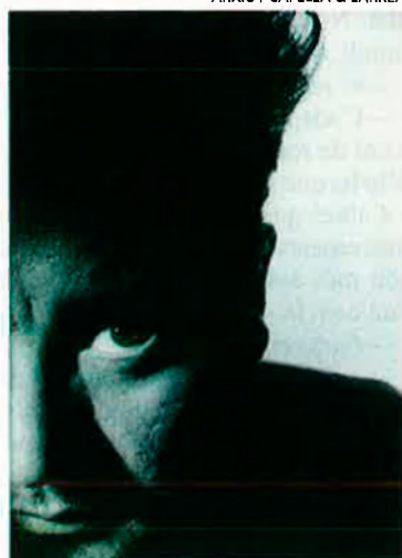
Philippe Starck posseeix avui dia la batuta mundial del disseny industrial. L'exposició abraça 85 peces.

i una ambientació de la sala ideada per Starck mateix que ofereix al conjunt de la producció enmig de l'obscuritat relativa tan sols alluminada per punts de baixa intensitat, aires de constel·lació. És l'univers de Starck repetit ara vuitanta-cinc vegades; l'"Starck-system" si voleu, absolut: motocicletes, ganivets, cadires, edificis, alguna aixeta, un espremedor revolucionari i manual..., però sobretot la genialitat i l'enginy, la visió única que el caracteritza i aquest veure-ho de qualsevol manera excepte des de la banal frontalitat del dia a dia. És Starck ell mateix, "entre Leonardo da Vinci i la NASA".