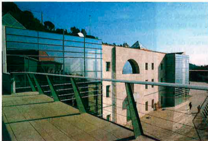
Escola d'Alts Estudis Judicials. Per la Generalitat, fomentarà les vocacions de jutge entre els estudiants catalans.

ques setmanes, s'encarrega de formar els jutges de l'estat durant quasi dos anys. En aquest temps els alumnes estudien teoria però també comencen a fer pràctiques en algun jutjat. Segons la nota que obtinguin al final d'aquest període podran triar lloc de destinació.