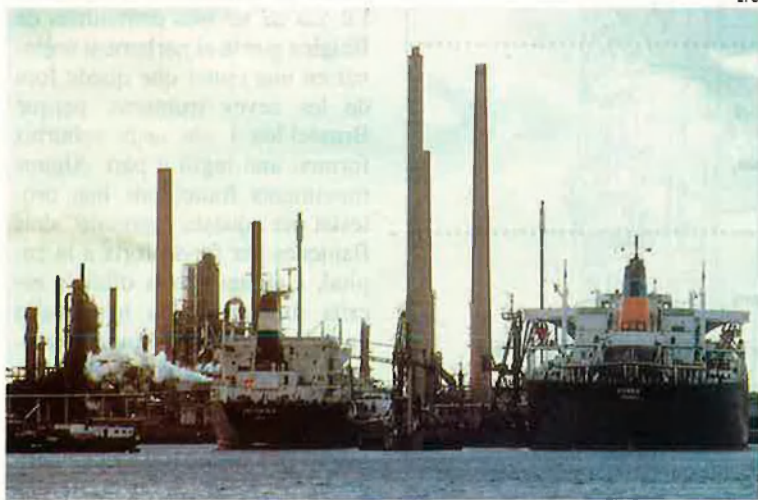
El port de Siomar, a Gant. Les empreses flamencs gaudeixen d'una situació financera millor que les valones, que han vist retallades les ajudes.