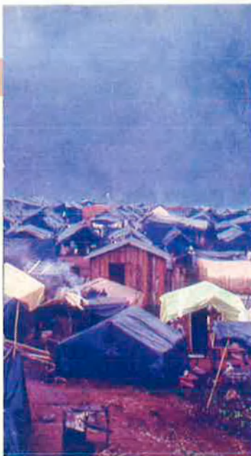
Els campaments dels 'Sem Terra' s'estenen per tot el país. Des d'aquests indrets, fan el vot a les 'facendes'.

Però la violència al camp brasiler és una violència estructural que margina milions de persones. És la violència de la gana permanent, de la mort prematura, de manca de serveis sanitaris i educatius, de falta de casa. La violència de tantes i tantes formes més d'exclusió social. M. P.