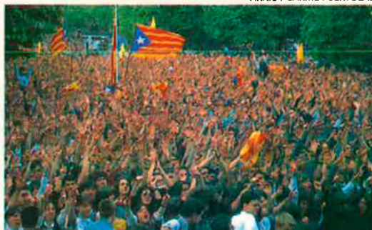
La reivindicació sobirana està present en la realitat catalana. Catalunya pot optar a un model de sobirania 'perforada'.

L'estudi "Catalunya 2015: opcions polítiques per al proper mil·lenni" que està elaborant el Centre Català de Prospectiva introdueix com a novetat el concepte de sobirania perforada . Aquest nou concepte supera la concepció tradicional que considerava la sobirania com una prerrogativa exclusiva de l'estat modern. La investigació constata que l'actual procés de globalització fa inviable el manteniment de la plena sobirania per part dels estats, que es veuen obligats a delegar-ne una part a d'altres instàncies de poder superiors. El procés de construcció de la unió europea n'és el millor exemple.