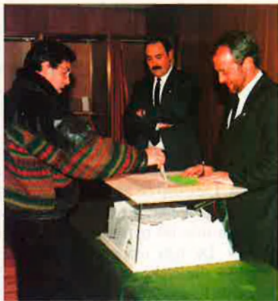
Una urna a Andorra la Vella. El cens d'electors és un 17% de la població.

"No crec pas que aquestes eleccions siguin irrellevants. Més aviat penso que tindran la virtut d'aclarir la posició dels electors sobre la política dels últims quatre anys. La llàstima és que el sistema electoral que tenim no permetrà arribar a un aclariment total. És un sistema electoral que no propicia la concentració, i que convindria canviar. Es pot fer de moltes maneres: amb dues voltes electorals a les parròquies, amb llistes