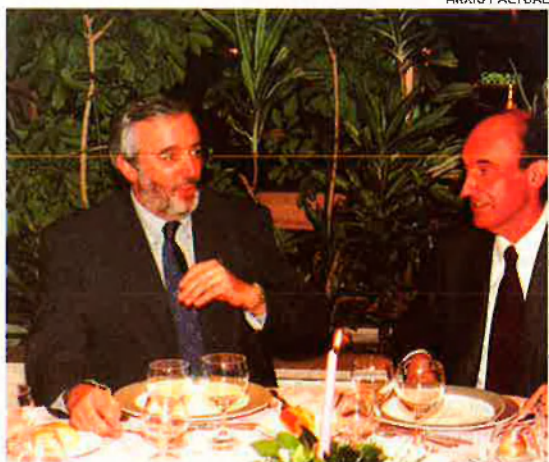
ARXIU / ACTUAL

el cens ha crescut en un 12%, augment que correspon majorment a una franja jove de nous andorrans assalariats o funcionaris. Continua essent molt difícil, per als assalariats, accedir a la política, en un país on no hi ha partits forts amb una àmplia militància, i molt menys encara la possibilitat de generar polítiques professionals.