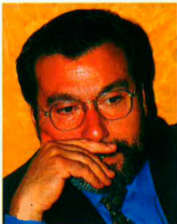
Asunción. L'ex-ministre d'Interior fou l'instigador directe del FIES.

sat, ha servit per aprofundir en la línia que va començar el FIES i, de fet, ha incorporat de manera indirecta aquest règim, tot i que el FIES com a tal continua existint. El capítol IV està dedicat al "règim tancat". Al igual que en el FIES, la incorporació dels presos a aquest règim vindrà donada per la perillositat o per la "inadaptació als règims ordinari i obert". La decisió d'incloure els presos en aquest règim i la disciplina que incorpore dependrà del consell de direcció. De nou, la direcció de la presó, i sense la intervenció del jutge de vigilància penitenciària, té atribucions per dictar la vida dels interns segons crega convenient, sense cap ordenació que legisle la situació. Les úniques normes generals coincideixen amb les que delimitava el codi FIES: els presos compliran la pena en cel·les individuals i aïllades de la resta d'interns, hauran de sotmetre's a un escorcoll diari que pot incloure, a discreció del cap de serveis, el despullament integral, i serà possible mantenir-los només tres hores al pati, on el màxim nombre d'interns serà de dos.