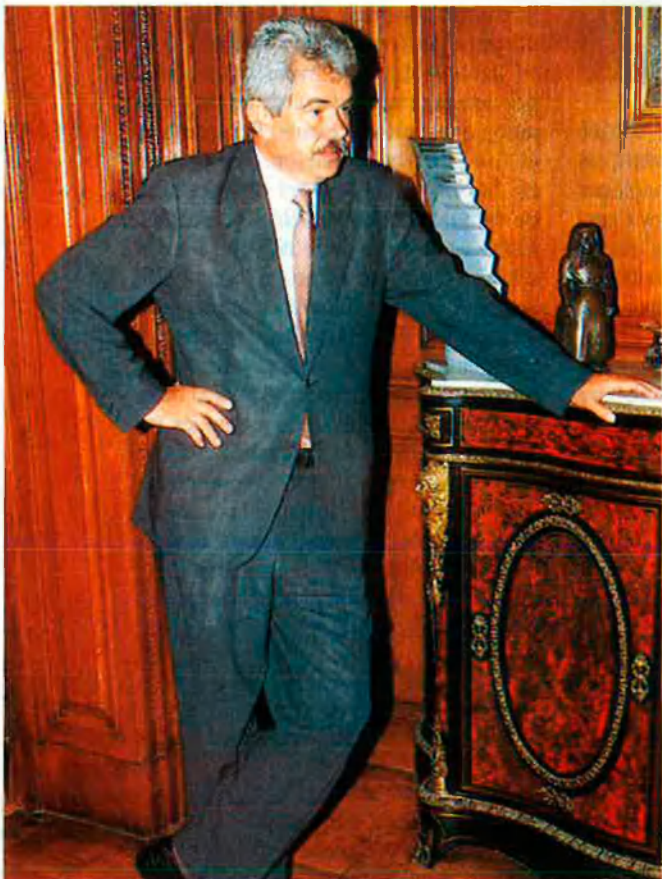
Pasqual Maragall. Ha manifestat que vol fer de Barcelona la capital europea de les telecomunicacions.

CTC, l'empresa amb participació de la Generalitat i l'Ajuntament que encablarà Barcelona, té per objectiu arribar a tot el Principat.