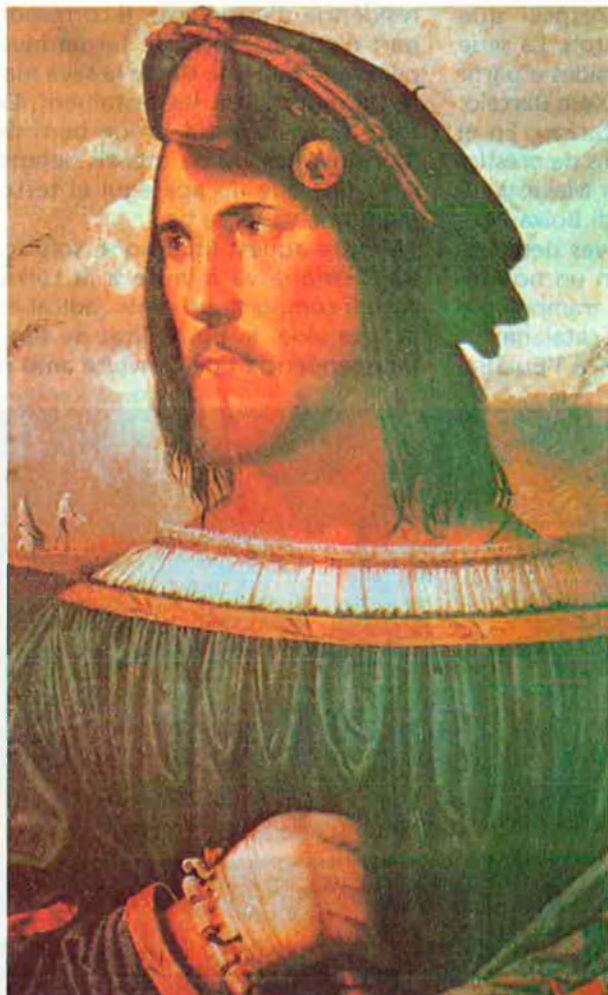
Cèsar Borja. És el protagonista de la novel·la i primer polític de la modernitat europea.

Però, O Cèsar o nada és, abans que res, una mirada dirigida, una focalització sobre el món modern, sobre un període clau en la construcció de l'època moderna, de l'Europa actual a través dels ulls d'un personatge conscient i sensible o, encara més, membre actiu i autor també d'aquests canvis: Maquiavel. I és que O Cèsar o nada , destil·lat a través d'aquest teorit-