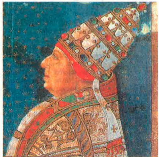
Alexandre VI. Un exemple del poder i de l'ambició de la nissaga valenciana.