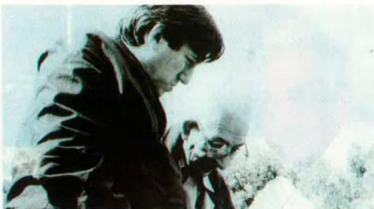
Dalt, a l'esquerra, acte de lliurament del Premi d'Honor Jaume I a Joan Coromines, al Saló de Cent de l'Ajuntament de Barcelona (setembre de 1981). Dalt, a la dreta, Joan Coromines treballant durant les vacances (Beget, setembre 1981). A l'esquerra, Joan Coromines amb Max Cahner (Puig de Bestracà, la Garrotxa, tardor 1984).