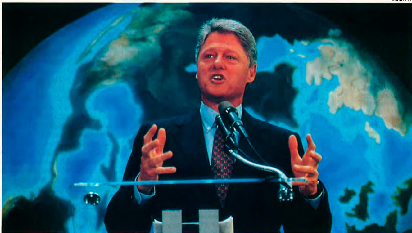
Bill Clinton. Ha assumit la defensa d'un pressupost equilibrat, un dels tradicionals estàndards del Partit Republicà.