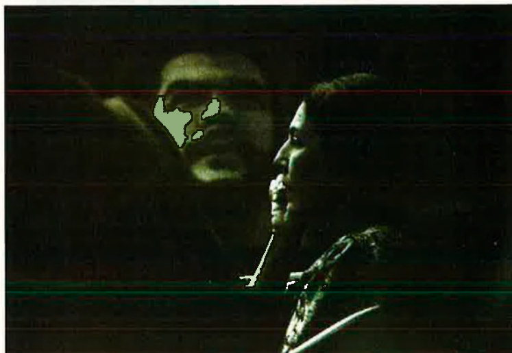
'Celia' (1968). Des que el Che va morir, el seu mite ha estat molt utilitzat.

i del Che han estat alimentats pels seus propis companys, que sempre els han posat com a exemples de valor i de dedicació.