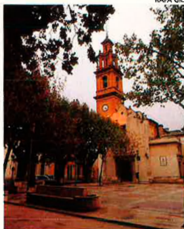
Església de Campanar. El poble encara manté la seua estructura dins la capital.