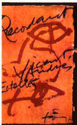
Dalt, detall de la composició que Antoni Tàpies ha creat per a l'edició del volum I del 'Mural del País Valencià'. S'hi pot llegir "recordant Vicent Andrés Estellés".

Després de molts anys, apareix 'Mural del País Valencià', obra global i espinàs sentimental de Vicent Andrés Estellés. Des de les entranyes, el poeta canta a través de 2.000 pàgines els elements que conformen la palpitació de la seua terra.