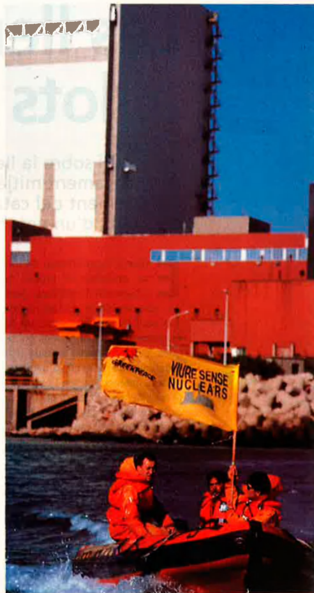
GREMO / GREENPEACE

Greenpeace ha comprovat que no pot actuar igual a Mururoa que a la Xina o a Tunísia, on el context social i polític és del tot diferent.