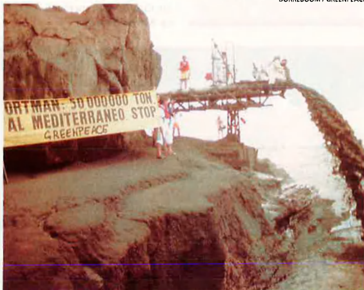
DORREBOOM / GREENPEACE

L'any 1986 Greenpeace va tapar la canonada d'abocaments tòxics de l'empresa Penarroya a Portman, Múrcia. Per fi, l'any 1990, el que era l'abocament més gran de residus tòxics va parar d'enverinar la Mediterrània.