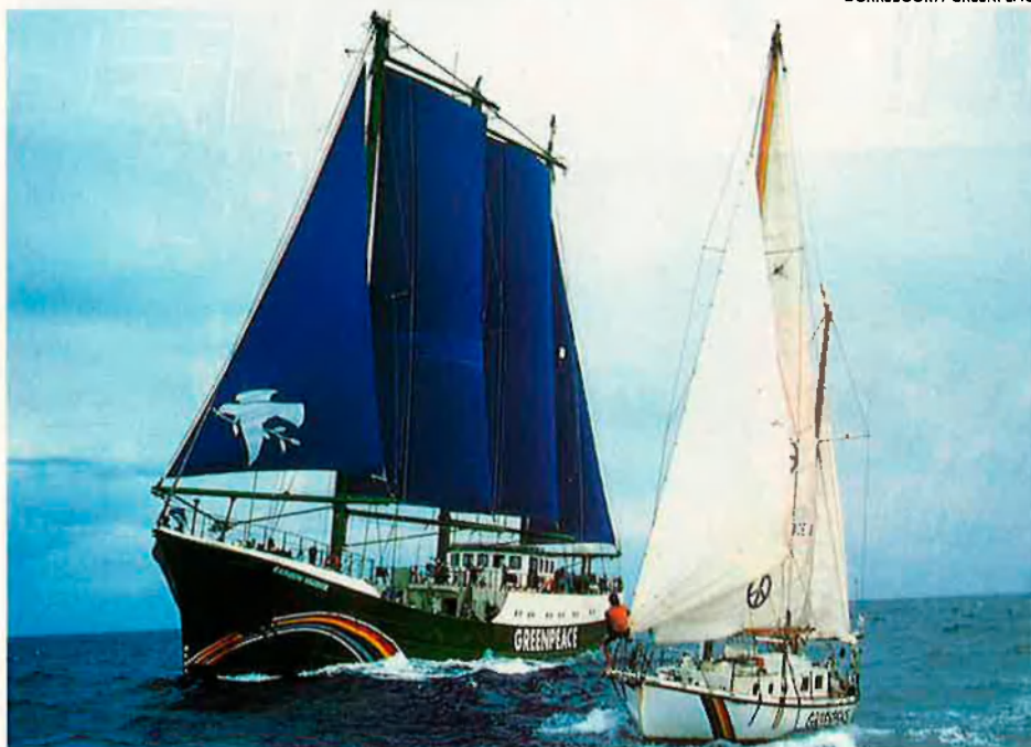
DORREBOOM / GREENPEACE

Greenpeace és conscient que quan s'oposa a una cosa n'afavo-