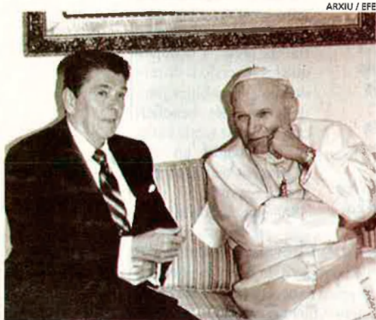
Reagan i Joan Pau II, reunits a Fairbanks, Alaska, al febrer de 1984.

Els EUA van lliurar molts documents secrets al Vaticà que relacionaven l'església de llatinoamèrica amb la ideologia marxista.