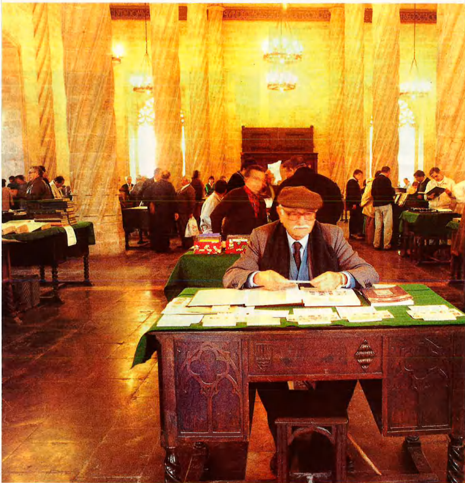
Dalt, la Llotja de la ciutat de València. Baix, a l'esquerra, els Encants de Barcelona. I a la seva dreta, de nou Manresa.