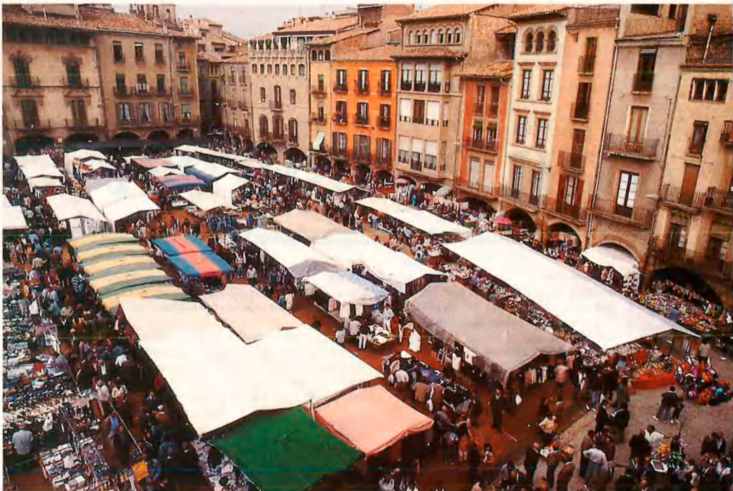
Dalt i baix a la dreta, dues imatges més de la Plaça Major de Vic. Baix, a l'esquerra, la Plaça Reial de Barcelona.