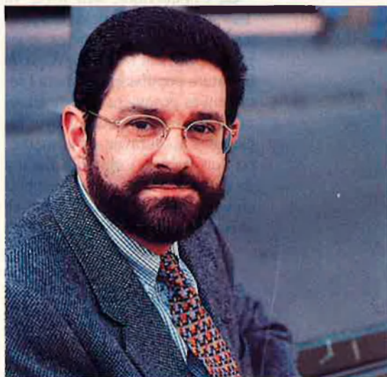
ARKIU / JORDI VICENT