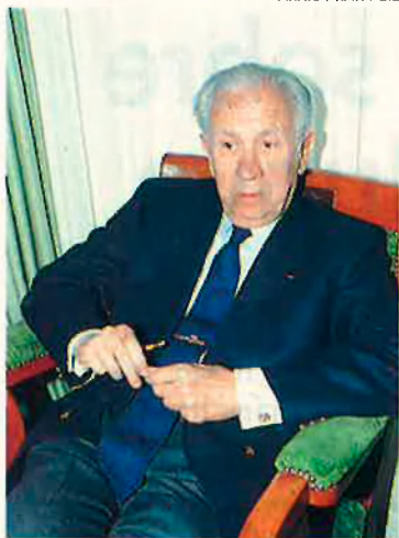
Joan Antoni Samaranch. Ha entrebancat el reconeixement del COC.