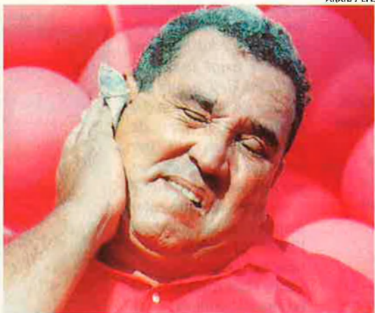
Arnoldo Alemán, candidat a la presidència d'Alianza Liberal. Acusa Violeta Barrios de deixar l'economia pitjor que no els sandinistes.

per únic objectiu de manar els uns sobre els altres. Així justifica l'existència de liberals i de conservadors, de somozistes i d'antisomozistes o de sandinistes i la contra. "Quan es van guanyar les eleccions del 1990 —diu Lacayo— els partits de l'UNO (Unión Nacional Opositora) l'únic que volien era continuar governant a la manera tradicional, és a dir, anorreament els vençuts, els sandinistes. Però Violeta va trencar aquesta tendència perquè volia ser la presidenta de tots els nicaragüencs".