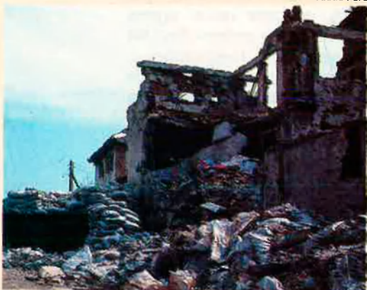
La destrucció de Bòsnia ha estat generalitzada. Els edificis culturals també han patit la desfeta.

Bosnia-Herzegovina Heritage Rescue, 12 Flitcroft Street, Londres WC2H 0DL, Regne Unit.