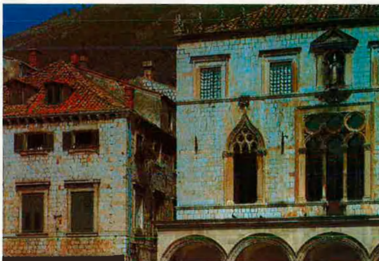
La ciutat vella de Dubrovnik és Patrimoni de la Humanitat. Els bombardejos serbis varen malmetre un llegat medieval que ara s'ha de reconstruir.

etnogràfica han estat robades". A Sarajevo, quaranta icones, dos quadres de Hodler i manuscrits islàmics van desaparèixer del Museu d'Art.