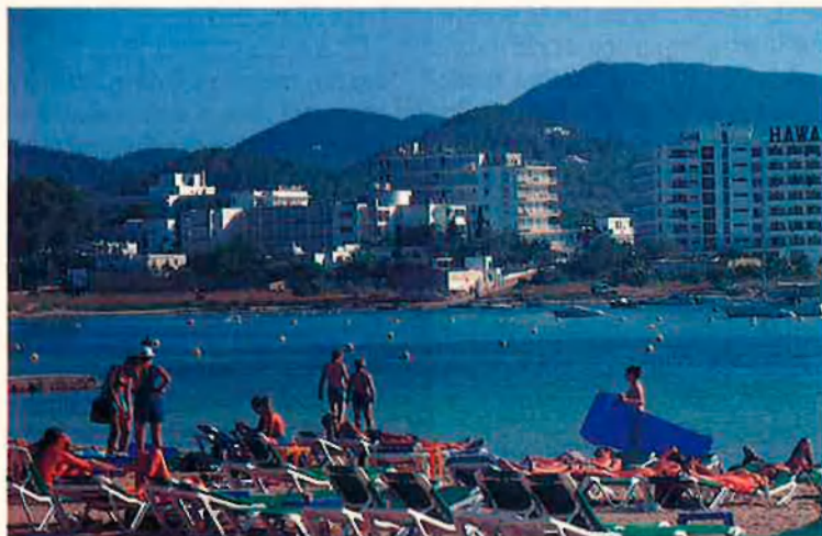
Sant Antoni de Portmany. Algunes veus demanen un turisme més selectiu.