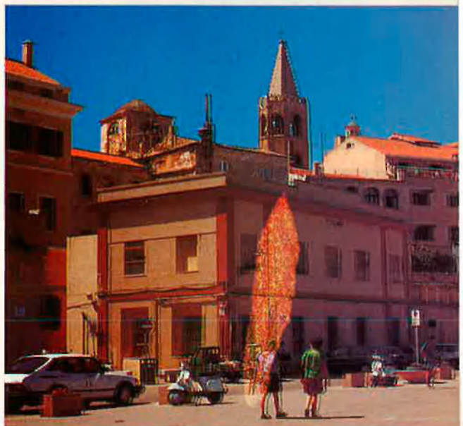
Dalt, la Seu. El seu campanar és el més imponent i destaca sobre les cases del port (baix).