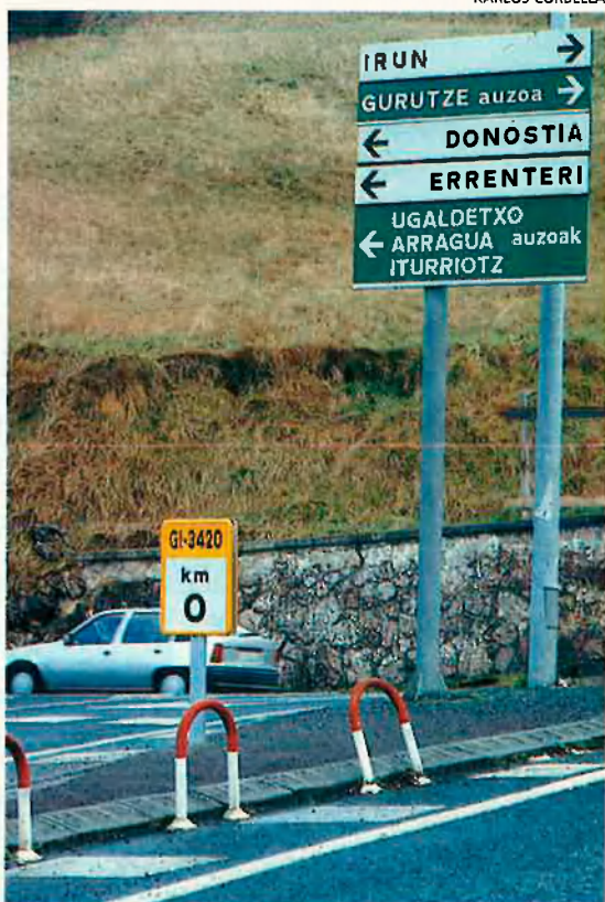
La retolació en èuscar s'ha estès ràpidament. Però la normalització topa encara amb algunes resistències.

com els francesos i els anglesos, ni tindrem tantes televisions privades ni tantes enciclopèdies en CD-Rom; ens haurem de valer d'unes altres llengües, d'acord. Però reconeguem, si us plau, a l'euskaldun, a qui se sent còmode en èuscar, que pot ser una persona normal d'aquest poble", diu Arrijolaleiba.