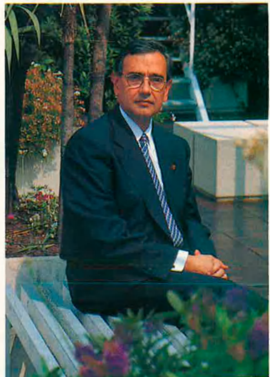
Dalt, dia de lliurament de diplomes als aspirants a mossos. Sota, el conseller de Governació, Xavier Pomés.