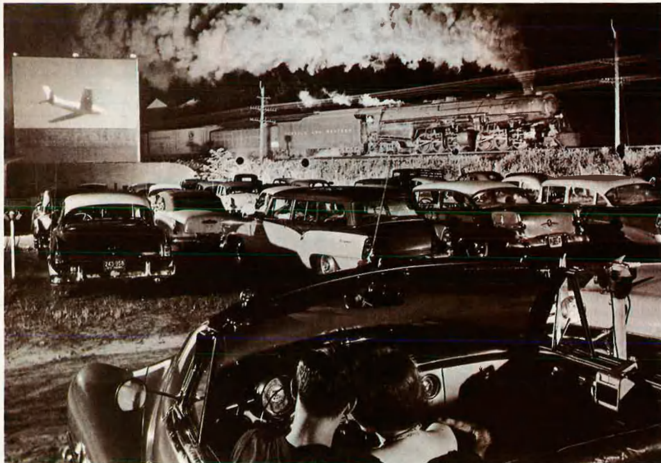
'Hot shot east Bound at lager, West Virginia', 1956.

Evans no deixava de reconèixer el paper de Stieglitz en la dignificació de la fotografia. Li ho reconegué, tot i que al camp de batalla Evans abanderava la legió de fotògrafs disposats a abolir qualsevol barrera dins la fotografia –l'artística i la professional–. Es tractava de dessacralitzar l'art i, de passada, implicar el fotògraf en l'esdevenir diari. Evans era la reacció contra Stieglitz, Charles Sheeler i Paul Strand, entre d'altres, artistes que es resistien a una relació promíscua de totes les disciplines fotogràfiques que coincidien en l'ús d'una mateixa tècnica i materials: revelat per contacte de negatius de gran format (8 per 10 polzades) sobre paper de gelatina de plata, un suport que substituïa el paper de platí i abocava fotògrafs professionals i artístics a una mateixa caldera. Estava clar que les subtils de tons i la qualitat exquisida de detalls captivava uns artistes obstinats encara amb el clarobscur.