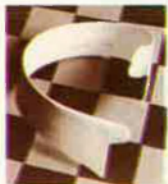
'Ide collar', 1915. Paul Outerbridge.

'Fotografia americana 1890-1965' és una de les exposicions que podran visitar-se durant tot l'estiu al Centre Julio González de l'IVAM. Vora dos centenars de treballs del fons del MOMA il·lustren tres quarts de segle d'activitat fotogràfica d'ultramar.