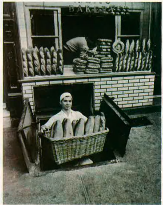
'Zito's Bakery, Bleeker Street, Nova York', 1937. Berenice Abbot.

Però els anys 50 despuntaven amb els gran èxits. La fotografia artística i l'ús professional —aquella pugna que es va desencadenar a principis de segle— s'aproximaven cada vegada més. Sense arribar a confondre-s'hi. Harry Callahan expressava l'austeritat d'una reflexió íntima i per la seua banda Irving Penn imprimia amb un rigor idèntic unes imatges que captava per als milions de lectors de Vogue . Les barreres s'erosionaven a mesura que una nova flexibilitat, una transigència, emergia tot mirant de reüll i amb certa desconfiança, una confrontació encara tèbia. El nou clima de convergència propiciava una sèrie de grans èxits que tanmateix no gosaven a alterar un ordre —més enllà de les propostes més o menys modernes— que s'emarcava forçosament en els límits rectangulars del paper fotogràfic. Europa sí que ho havia aconseguit dècades abans. Els seus collages dels anys 30 s'alimentaven amb l'especejament fotogràfic i l'ús de materials diversos. La modernitat americana no transgredia els límits del respecte. La subversió alliberadora de les avantguardes artístiques sobre la fotografia hi va desem-