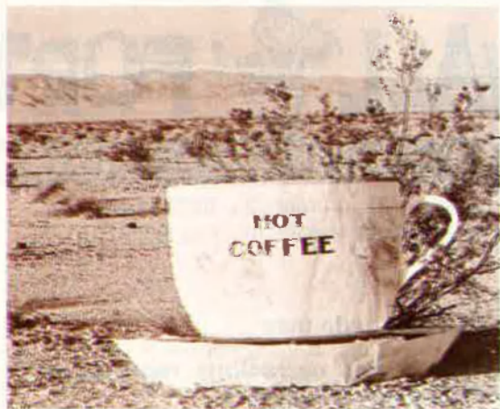
'Hot coffe, Mojave Desert', 1937. Edward Weston.

De passada, Galassi ha volgut retre homenatge en aquesta exposició a la trajectòria del MOMA i la seua aposta decidida per la fotografia. De fet, és el MOMA el primer centre d'art modern que disposa des del 1940 d'un departament exclusivament dedicat a la fotografia. Ara s'hi reproduceix, a partir de 183 treballs pertanyents a la col·lecció del departament, la història de la fotografia nord-americana des del 1890 fins el 1965.