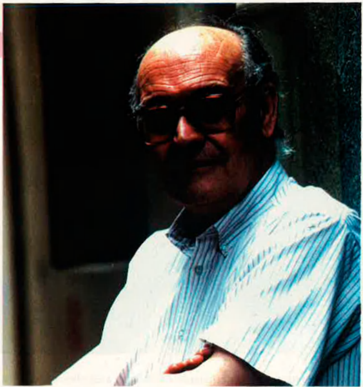
Modest Prats. El teòleg afirma que amb l'anglès hi ha contacte, però que amb el castellà, el català, hi té un conflicte.

M. P.: Només una observació. Plantejat des d'aquest