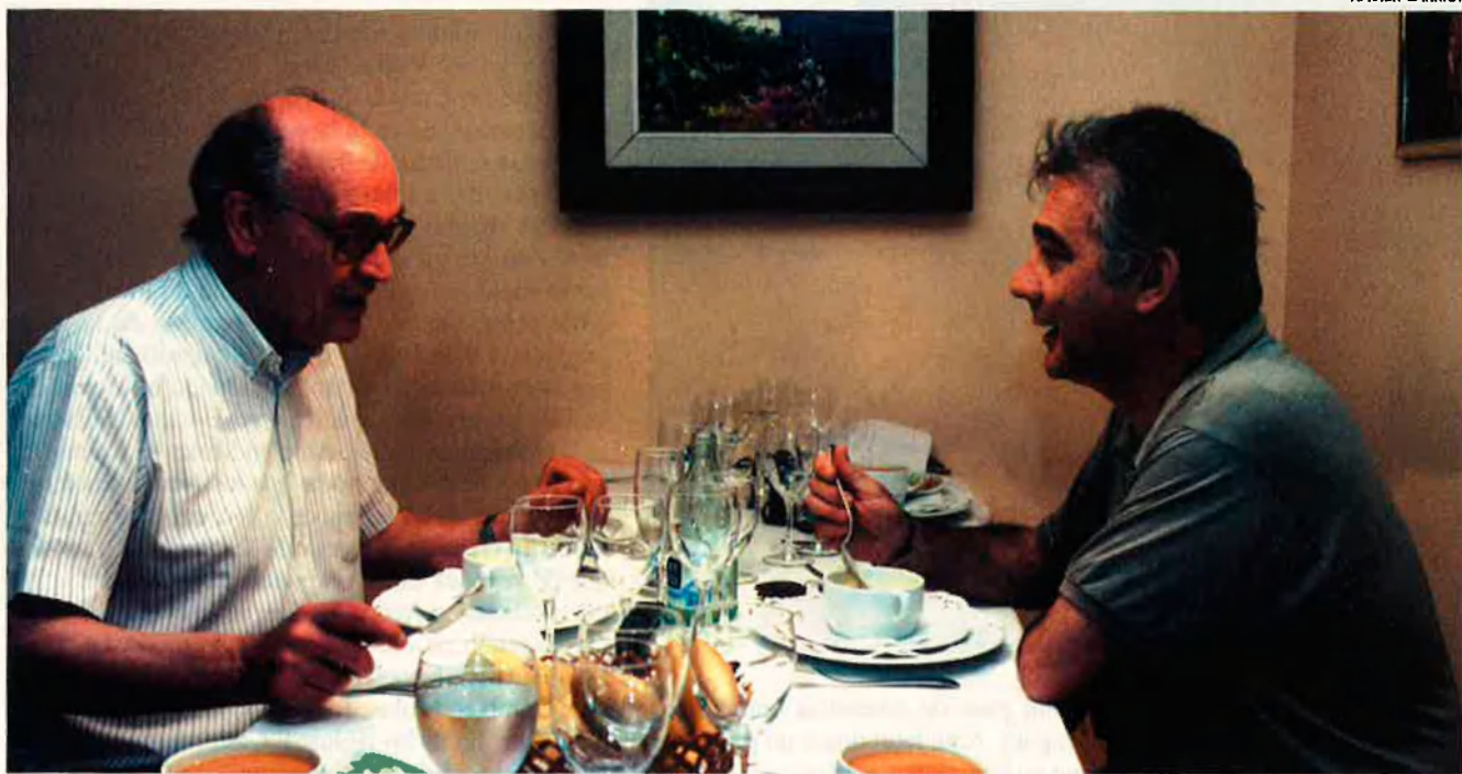
MODEST PRATS / JOSEP MARIA NADAL