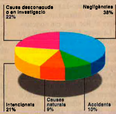
INCENDIS FORESTALS A CATALUNYA PER CAUSES EN EL PERÍODE 1992-1995

La netedat és un arma més poderosa que no sembla. No deixar brossa és important, com sigui que les deixalles contenen productes inflamables que afavoreixen l'aparició i la propagació del foc. Cal saber per on circulem amb