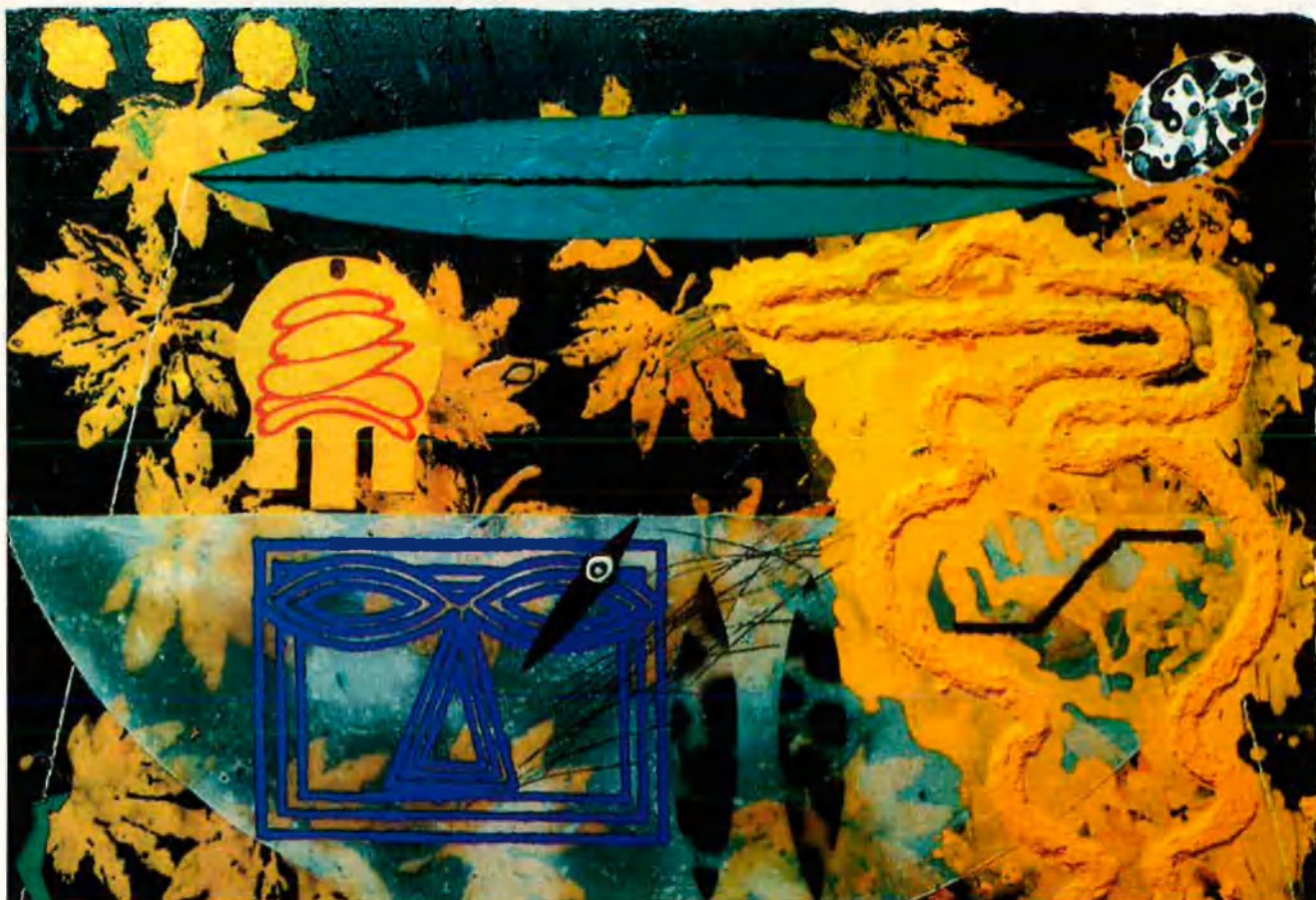
'Nit transfigurada' (1995). Formes geomètriques, d'altres més sinuoses, tot cap en l'obra de Viladecans.