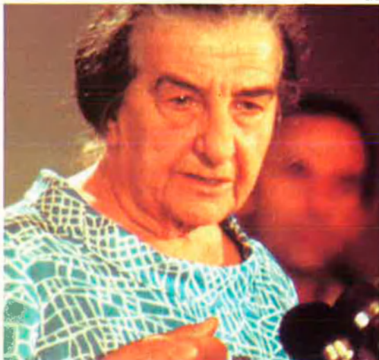
Golda Meir. Pragmàtica i dura, l'ex-cap del govern d'Israel va ser implacable amb els països àrabs.

—S'ha de reconèixer que la realitat del 1996 no té res a veure amb la del 1982, però mentrestant continuem essent l'anècdota. C. C.