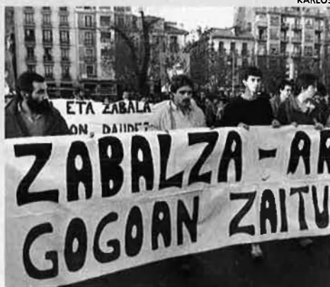
Manifestació contra la tortura. Un invent?

difici va escoltar els seus crits i ho va denunciar al jutge -sembla que ja estava farta de somiar cada nit amb crits esgarrats- i hi anaren dos forenses a visitar-lo. Després de veure el pessim estat del detingut li indicaren que tornarien immediatament amb una ordre judicial. Però men-