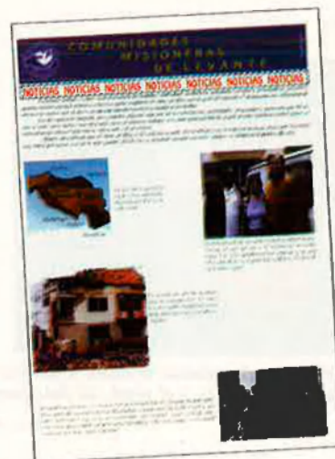
‘Comunidades misioneras de Levante’. El grup al País Valencià.

Avui, doncs, res de flirty fishing (FF): “No cal dir que el fet que vincularem l’amor espiritual de Déu amb l’expressió física i sexual d’aquest amor en una modalitat d’evangelització individual tan íntima no va ser ben acollit per la major part de la cristiandat (...). És més, un ampli sector de la gent religiosa arriba a donar la impressió errònia que la sexualitat prové del Diable i que no és idea ni creació de Déu”. Avui, doncs, res d’incitació a la sexualitat infantil i juvenil, ni d’abusos a menors, ni incest: “Hem repudiat i prohibit en totes les nostres comunitats, de forma oficial i rotunda, tots els anteriors escrits, especulacions filosòfiques o teològiques, i opinions personals (...) que, d’alguna manera, poguera entendre’s que abonen o justifiquen el fet de tocar sexualment els nens...”. La Família procura espolsar-se de damunt aquella imatge que la va lligar a les pràctiques sexuals abusives. S. H.