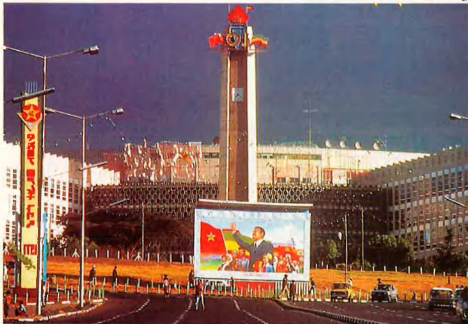
Cartell de culte a Mengistu a Addis Abeba. L'ex-president d'Etiòpia va fugir a Zimbabue el maig de 1991.

Seguint la màxima del Che Guevara de crear "un, dos, tres vietnams" per derrotar l'imperialisme, els eritreus van fomentar la rebel·lió dels tigres per afeblir el règim comunista. Els tigres van entrar a Addis Abeba el maig del 1991 menats per Meles Zenawi. Com a premi, els eritreus van obtenir el dret a la independència, per la qual lluitaven des del 1961, arran de la decisió de l'emperador Haile Selassie de deixar-los sense l'àmplia autonomia que tenien des del 1952.