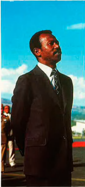
Dalt, Mengistu Haile Mariam. A la dreta, Addis Abeba, que des de la Constitució del 1994 és considerada una entitat federada.

xista Meles Zenawi, presenta aquest judici contra l'antic règim com una demostració que els temps han canviat al país. Zenawi, un guerriller convertit al lliure mercat, és acusat per l'oposició d'autoritarisme i d'haver convertit l'administració en un reducte de persones d'origen tigre. Els ahmara, majoria a Addis Abeba, havien ocupat tradicionalment els alts càrrecs de l'imperi.