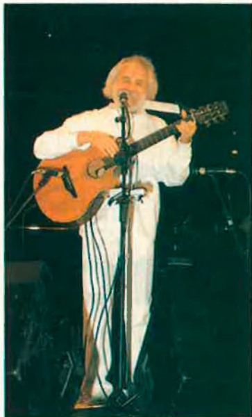
George Moustaki, en el recital a València d'homenatge a Ovidi Montllor. Fou menyspreat per TVV.

municació amb les mateixes mesures. Actes que han estat tradicionalment oberts i plurals s'han vist ara significats per tot el contrari. És el cas de la recepció de cap d'any, que el president de la Generalitat organitza per a la premsa. En la seua última edició, alguns mitjans, com ara EL TEMPS, no van ser convidats. La cosa no queda aquí, ja que els mitjans valencians en català han vist suprimida la partida econòmica que els pertocava per foment de l'ús del valencià. Això no afecta simplement els mitjans en valencià sinó que també discrimina d'altres per qüestions informatives. És el cas del diari La Verdad d'Alacant, que va ser "castigat" per la directora general de Mitjans de Comunicació, Genoveva Reig, perquè no li va agradar un titular de portada. Reig va retirar una invitació a un periodista de La Verdad per participar en el viatge a Brussel·les que Zaplana va realitzar el passat mes de setembre perquè el diari alacantí va titular en primera plana i entre cometes, ja que era una declaració del secretari d'Estat d'Indústria: "Alacant perd el Tribunal de Marcas per culpa de Zaplana". Potser tots hem perdut alguna cosa més.