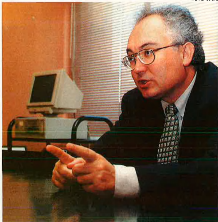
"S'ha de retallar de l'estat a les autonomies i d'aquestes als ajuntaments. Hi ha coses que, de l'estat als ajuntaments, no hi saltaran pas."