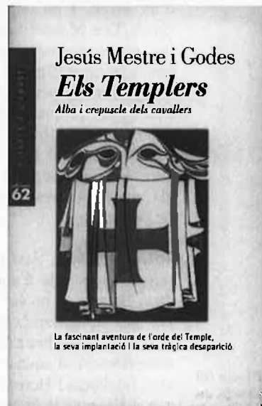
Jesús Mestre i Godes ELS TEMPLERS De l'autor d' Els càtars i del Viatge al país dels càtars .