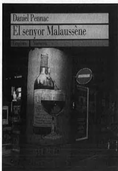
Daniel Pennac EL SENYOR MALAUSSÈNE Una visió trepidant i no resignada sobre el futur de les nostres ciutats.