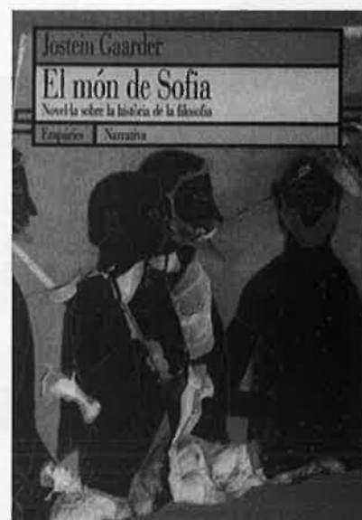
Jostein Gaarder EL MÓN DE SOFIA 14 a ed. catalana. El llibre més venut a tot el món... i a Catalunya.