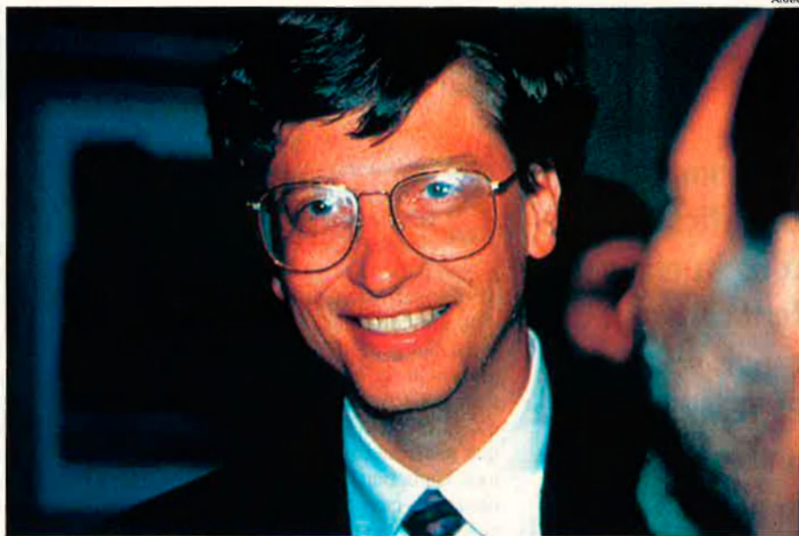
Bill Gates, creador del programa. La implantació del Windows 95 és enorme.

Antoni Gurguí explica que la noranta de productes informàtics existents en català topa amb les mateixes dificultats