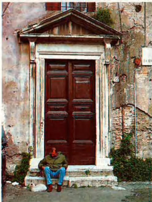
Dalt, un portal d'estil neoclàssic. Al costat, el Pòrtic d'Octàvia. Bella Roma.

Indrets. Un indret encantador és el Museo Barracco, la col·lecció d'escultura antiga arrellegada per un aristòcrata romà i cedida amb el seu palau a l'estat. Situat a la Via dei Baulari, prop de l'animat i popular Campo dei Fiori, és un museuet deliciós, molt ben instal·lat, que al seu soterrani té les restes d'una vil·la patrícia romana esdevinguda hostel a les acaballes de l'imperi. També impressiona, per la seua bellesa imponent i a l'ensems lleugera l'antic Panteó d'Agrippa reconstruït per Adrià. La Piazza della Rotonda que li fa front és un dels llocs urbans més animats i més íntims, segons l'hora de la visita. La nit és l'hora millor per passejar per la Piazza Navona, sobre el solar del circ de Domicià, en un bordell del qual va ser martiritzada, diuen, la joveneta Agnès, com recorda l'església barroca de santa Agnese in Agone que dialoga amb la font dels rius de Bernini des de fa segles. La posta del sol