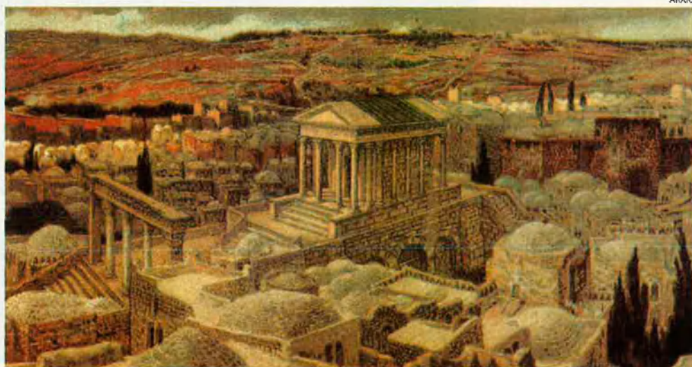
El temple romà d'Adrià sobre l'esplanada del temple. L'emperador Adrià va protagonitzar una "purificació ètnica" contra els jueus i cristians de Jerusalem.

La tercera ciutat de l'islam. Per a l'islam Jerusalem és també una ciutat santa: el seu nom àrab, El Qods, ho demostra. No és vers Jerusalem que es giraven els creients per orar al començament de la revelació corànica quan Mahoma maldava per introduir en l'islam naixent els vells profetes, Abraham, Moisès i Jesús?