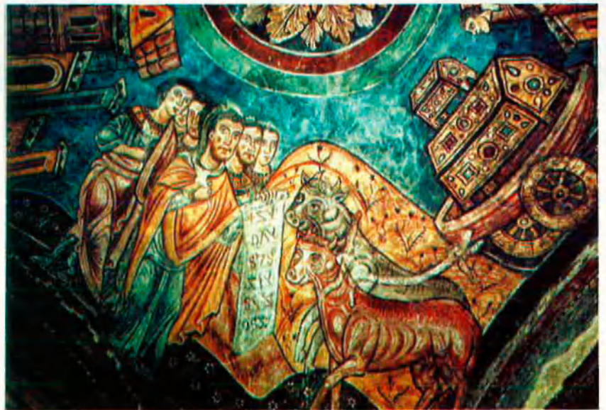
David, el rei-pastor, va fer de Jerusalem una vera capital religiosa i política. David va dur l'Arca de l'Aliança a la ciutat elegida: Jebus.

Des d'aleshores, per a tots els jueus, Jerusalem, també anomenada Sion, és més que una ciutat santa: la ciutat de la memòria, el símbol de la unitat, la tradició encarnada en un lloc: “Déu és a Jerusalem, aquesta no pot dubtar”, canten els psalms. En els textos sagrats els pro-