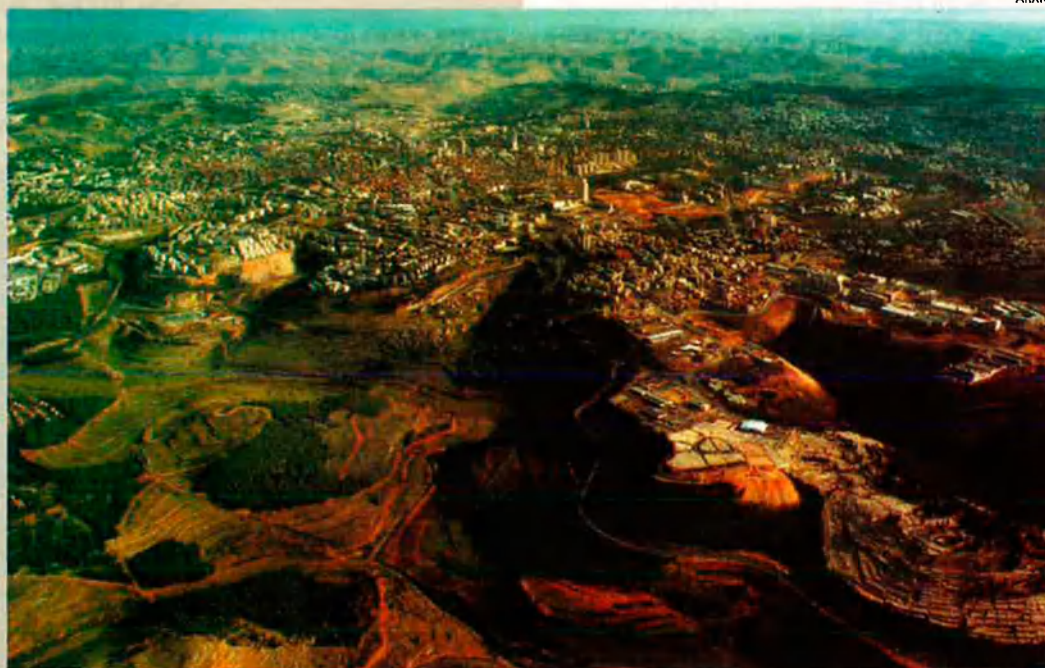
Vista aèria actual de la ciutat. A l'esquerra, els nous veïnats de jueus ortodoxos.