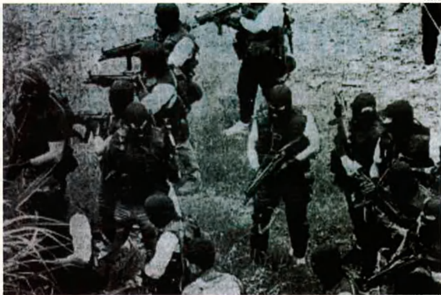
Policies de Hong Kong rastregen una zona a la recerca d'elements mafiosos. A la colònia anglesa el problema de les màfies arriba a cotes espectaculars.

Una màfia amb tradició. Sigui com sigui, la màfia xinesa existeix i no justament des d'abans d'ahir. Ja a finals del segle passat la policia de Hong Kong encunyava el mot triada per tal de definir genèricament el conjunt de societats iniciàtiques xineses que feien ús simbòlic de banderes i emblemes de forma triangular. Una forma geomètrica que representa tot plegat l'harmonia entre el cel, la terra i l'home. Però l'existència d'aquestes so-