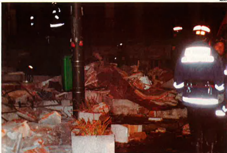
Al setembre del 94 la màfia xinesa va decidir cobrar els seus 'serveis' des-trossant el restaurant Tiananmen de Madrid. L'extorsió no és un fet aïllat.

Cal dir que la Brigada d'Investigació de Barcelona emplaçada a la caserna de la Vermeda coincideix a grans trets amb els seus col·legues de Madrid. Segons un dels inspectors més experts en la matèria: "Els xinesos arriben a través d'alguns capostosts després d'haver-los captat fins i tot per anuncis apareguts a la premsa d'aquell país. Les rutes passen també per Rússia i Eslovàquia amb l'objectiu de saltar cap a Alemanya. També s'han detectat