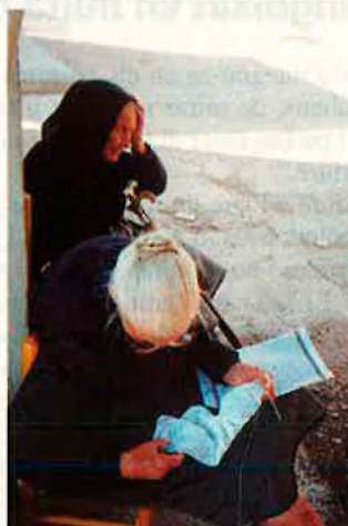
Les dones de Benafigos carden llana o fan ganxet, al carrer. “Són dones que vesteixen molt polidament, amb detallets fins, i les seves cares són afables”.

la piedra no es buena, ya podría haber caído en la cabeza de Puchol”.