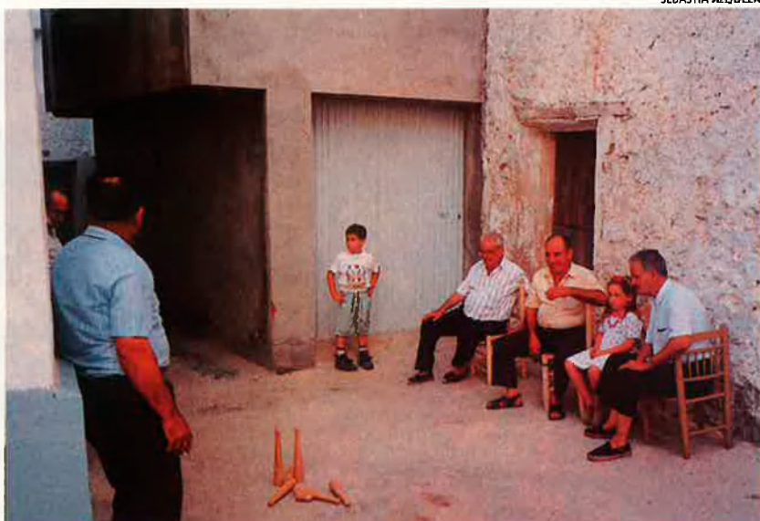
A Lluçena juguen a birles. “Els homes juguen amb alegria, competeixen sense tensió visible, es fan bromes de bona llei”.