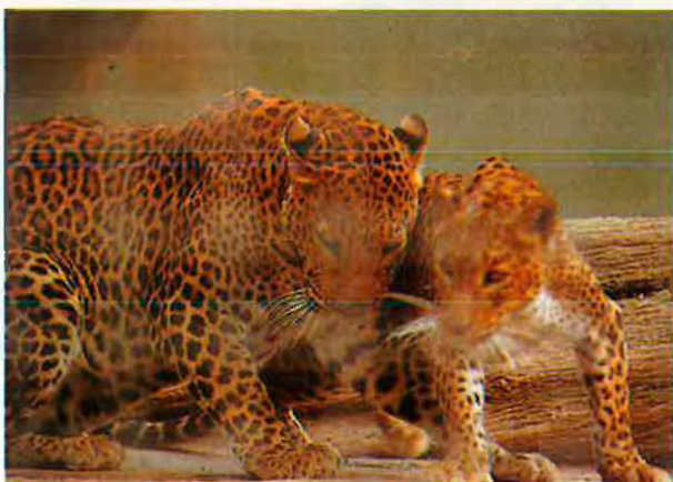
La nova ubicació del zoo ha alçat un agre confrontament. L'extrema contaminació és una de les causes.

els corrents climàtics que arrossega el riu –declara Cases–. Ni les palmeres de la Vila Olímpica no han pogut arrelar-hi, per aquesta brisa del detergent, i és aquí que volen construir una sabana africana?"