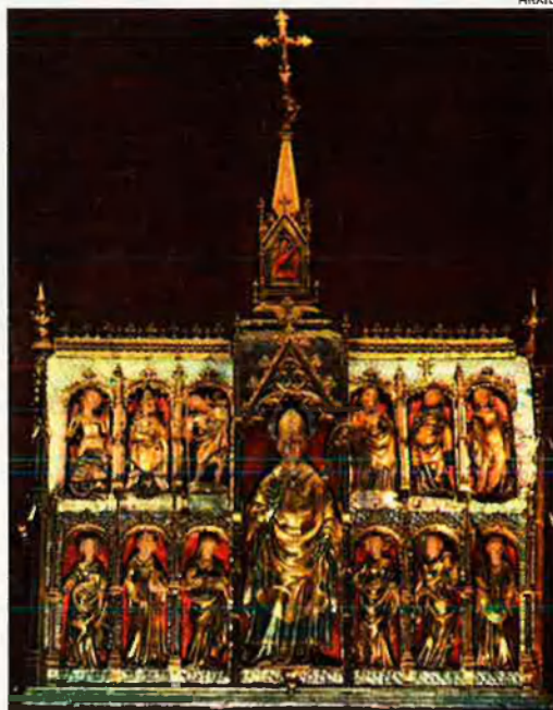
L'arqueta de Sant Martí, abans i després del robatori. On són les peces que falten?