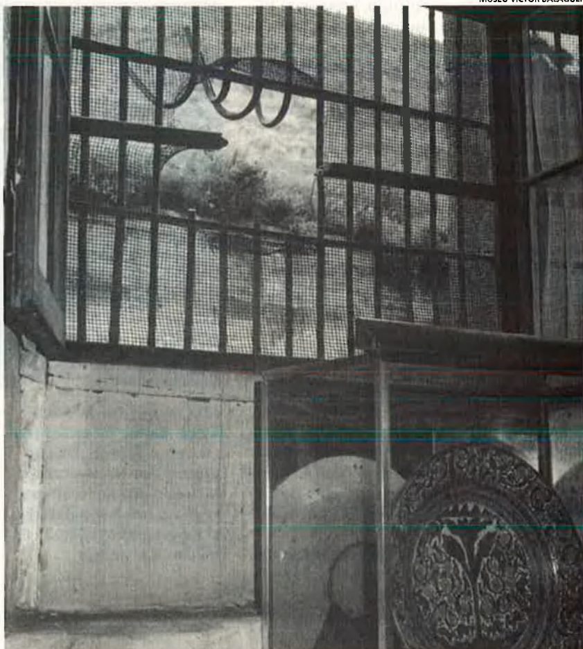
MUSEU VÍCTOR BALAGUER

Avui encara resten per localitzar una custòdia processional, un oli de Vicente López, documents de l'Arxiu Històric Eclesiàstic, peces d'orfebreria i, fins i tot, una recepta ca-