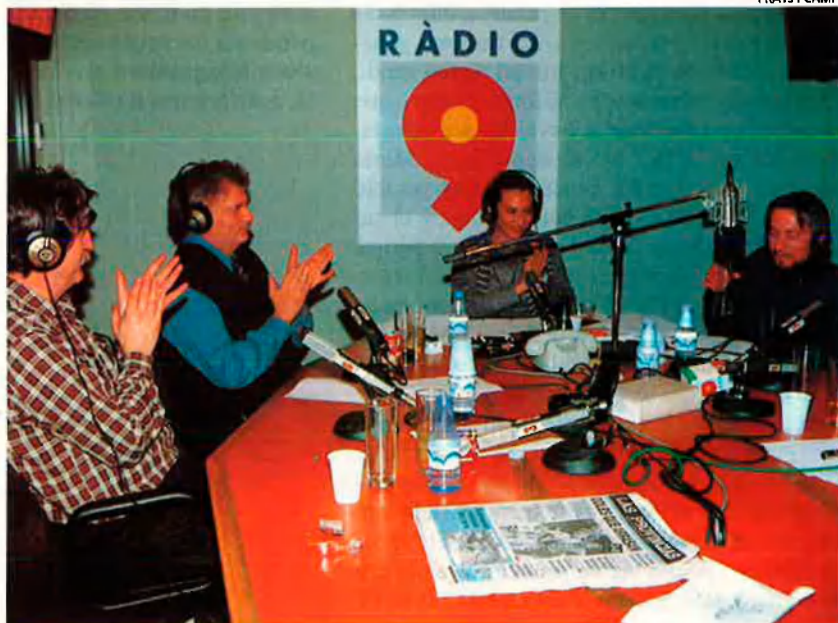
FRAITS I CAMPS