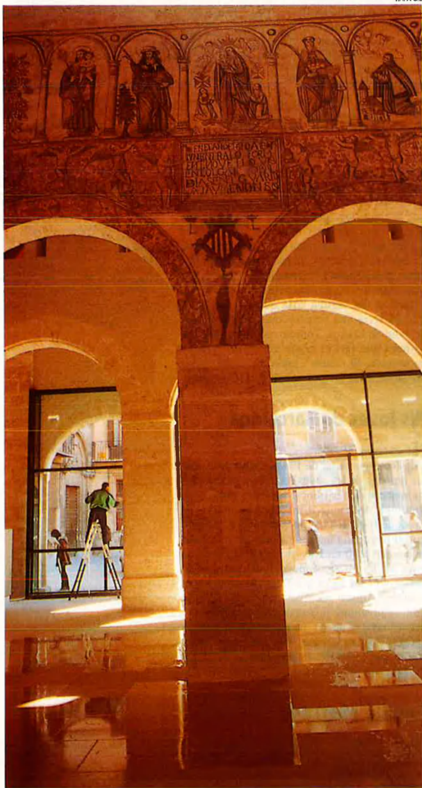
L'Almodí serà inaugurat aquesta setmana. L'Ajuntament no hi instal·larà la col·lecció de peses i mesures com estava previst.

Exactament 131 anys després, l'equip de govern municipal continua amb una desorientada política museística i de patrimoni. L'Ajuntament compta amb quatre col·leccions, una paleontològica, una de peses i mesures, una de papallones i una altra de monedes que no sap on ubicar, mentre que dos magnífics edificis recentment restaurats, l'Almodí i les Drassanes, estan buits i sembla que es dedicaran a exposicions temporals. La també recent i rigorosa restauració del xalet de Blasco Ibàñez no compta, en canvi, amb les mesures de seguretat que requereix una casa-museu i els hereus de l'escriptor s'han negat a cedir el seu llegat fins que les garanties siguen totals. El Mercat Central i el de Colom, el primer ple de vida i el segon ja abandonat pels venedors, necessiten una ur-