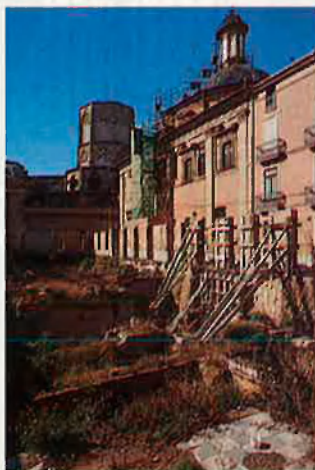
La plaça de l'Almoïna. Conserva restes arqueològiques de la Valentia romana.