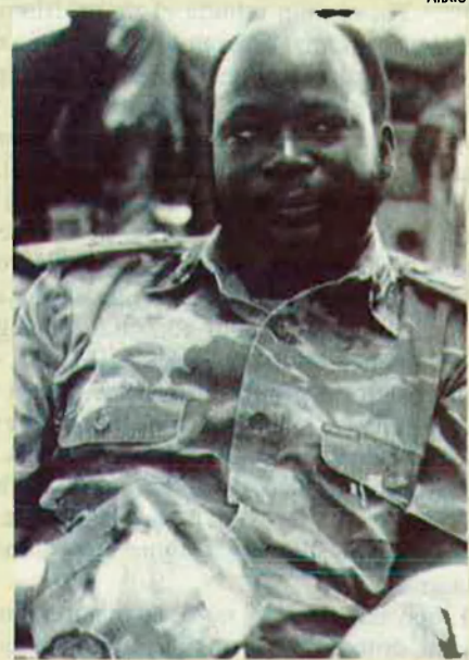
John Garang. Dirigeix els rebels que s'oposen al govern sudanès.