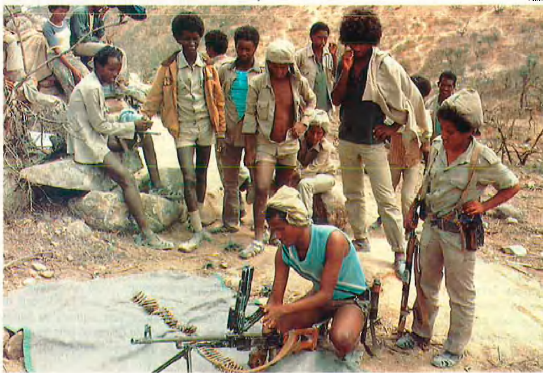
Eritrea (en la foto, guerrillers d'aquest país) és un dels països barallats amb el Sudan. El règim islamista sudanès, inspirat per Hassan al-Tourabi, desperta molts recels internacionals.